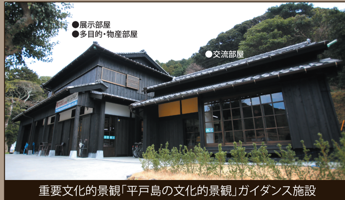
重要文化的景観「平戸島の文化的景観」ガイダンス施設